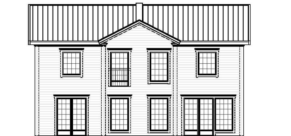
Fasad mot väster