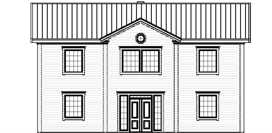
Fasad mot öster