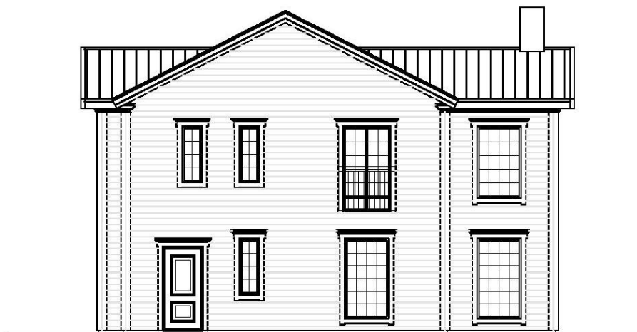
Fasad mot norr