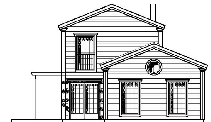
FASAD MOT SÖDER, VÄSTANVÄGEN