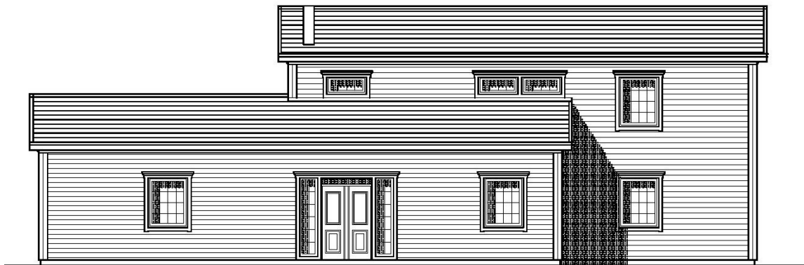
ENTRÉFASAD MOT ÖSTER