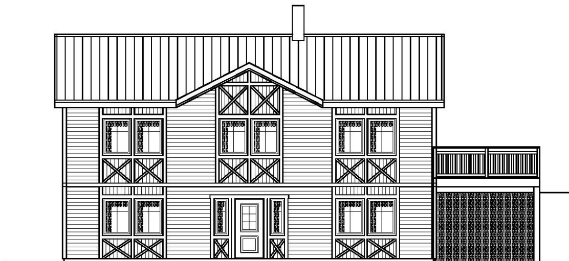
ENTRÉFASAD MOT VÄSTER