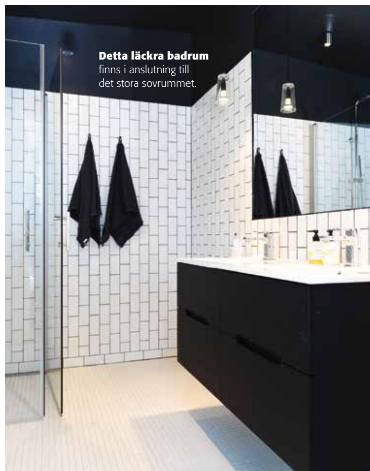
Detta läckra badrum finns i anslutning till det stora sovrummet.